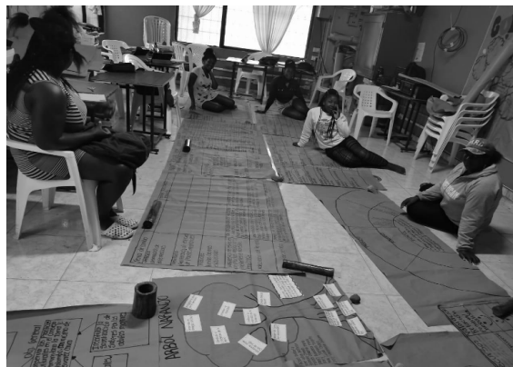
Fotografía 4. Actividades de la clase en el Diplomado en Gerencia Social y Gestión de Recursos Naturales en Territorios Ancestrales y Colectivos.

En ese sentido, en Ready for Impact , ASOMUAFROYO tuvo que construir un proyecto que, contemplara el fortalecimiento de su liderazgo y el fortalecimiento comunitario (ver fotografía 4). Esto pasó por dos fases previas constitutivas del proyecto, la fase personal que acompañó el proyecto de vida de algunas de las integrantes, en conexiones con sus motivaciones e intereses personales y organizativos (Universidad Icesi, 2020).