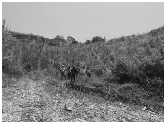
Fotografía 1. Antes del predio del Centro de Innovación Sociocultural y de Medicina Ancestral de la vereda Yolombó.

ubicación en el Cauca, uno de los departamentos del país con más amenazas y riesgos para los liderazgos sociales, que durante el 2020 registró 200 agresiones a lideresas y líderes sociales, de las cuales el 25 % (52) fueron asesinatos (Somos Defensores, 2020).