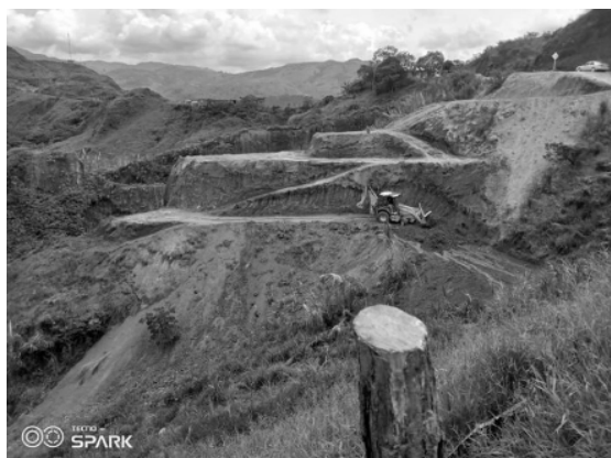
Fotografía 2. Después del predio del Centro de Innovación Sociocultural y de Medicina Ancestral de la vereda Yolombó.

Cabe resaltar que Ready for Impact se implementó en el contexto de emergencia por la pandemia de COVID-19. Durante su desarrollo, fui la asistente de investigación destinada por el CEAF y participé conjuntamente con ASOMUAFROYO en el diseño de formas