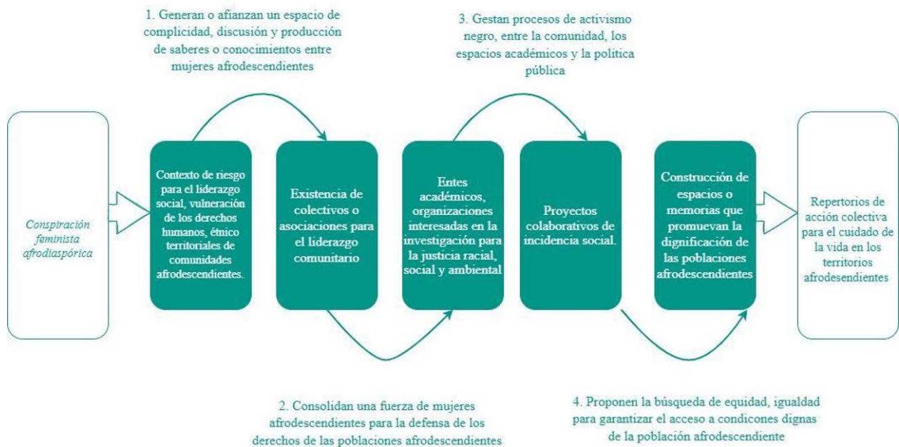
Esquema 1. Rastreo de procesos en la génesis del Centro de Innovación Sociocultural y de Medicina Ancestral de Yolombó.

Después, de reafirmar que la génesis del Centro se podía catalogar como un repertorio de acción colectiva antiextractivista, vinculado a formas de cuidado de la vida y los territorios de ASOMUAFROYO, para descifrar cómo se convirtió en un repertorio de acción colectiva para el cuidado de la vida y los territorios afrodescendientes de La Toma, se rastrearon los procesos de la categoría conspiración feminista afrodiaspórica y de la génesis del Centro de Innovación (ver esquema 1).