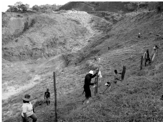
Fotografía 3. Jornada de limpieza comunitaria del terreno destinado al Centro de Innovación Sociocultural y de Medicina Ancestral de la vereda Yolombó.

geológicos y geomorfológicos y su diseño arquitectónico (ver fotografía 3).